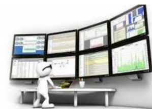
Plano de Melhoria – AM2 AEMDS